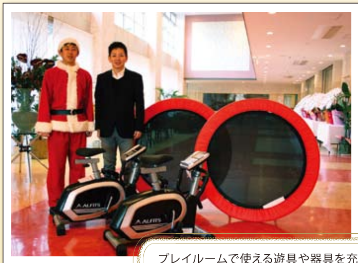
グイン・ホーム (神戸市北区) エアロバイク、 トランポリン

プレイルームで使える遊具や器具を充実させたいという思いでお願いしました。体を動かすのが好きな子はもちろん、あまり得意じゃない子も笑顔で楽しんでます。とても喜んでいました! 本当にありがとうございます。大切にに使わせて頂きます。