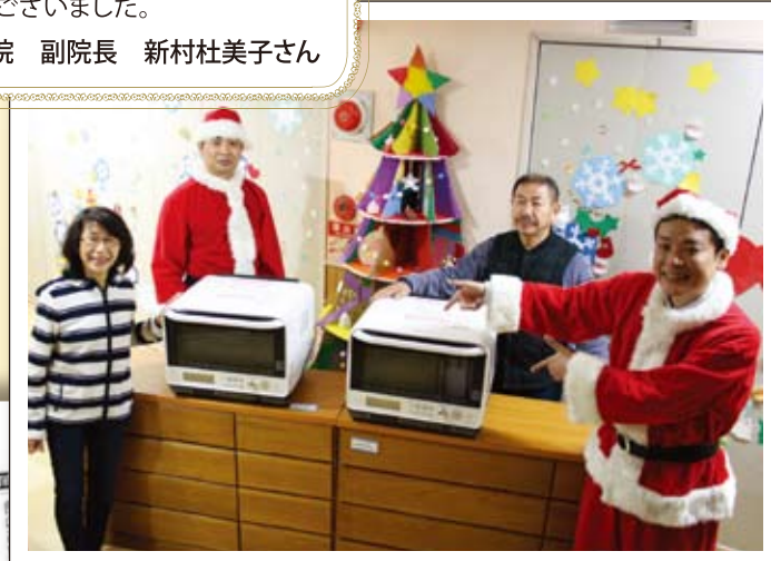
神戸実業学院 (神戸市兵庫区) 整理ダンス、 電子オープンレンジ